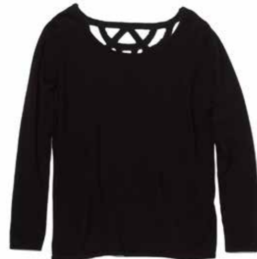
Pull Twist & Tango