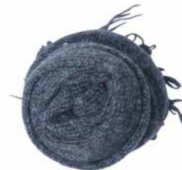
Écharpe Samsøe Samsøe