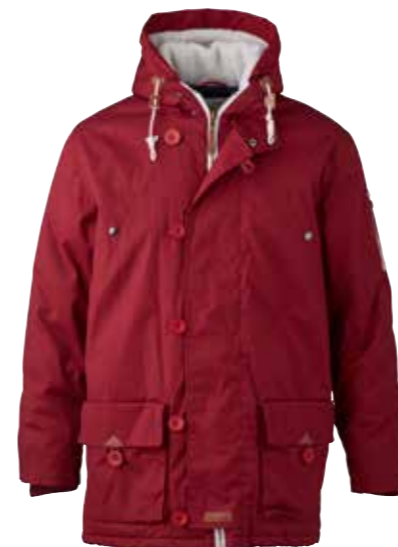
Imperméable Knowledge Cotton Apparel