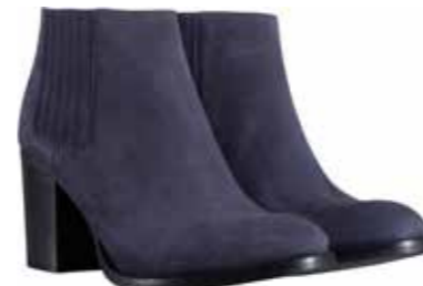
Boots Samsoe &amp; Samsoe