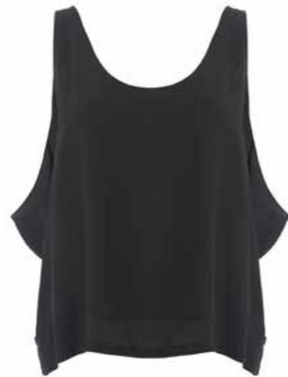
Top en maille Samsøe Samsøe

La marque danoise surfe sur les tendances actuelles sans s'y soumettre totalement. Samsøe Samsøe incarne une conception scandinave de la mode : lignes épurées, attention portée aux détails et design avant-gardiste.