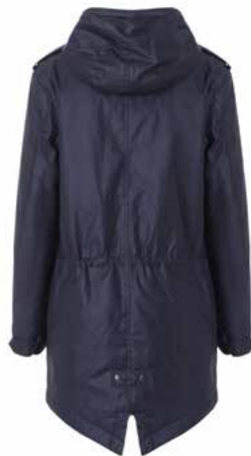
Parka Samsøe Samsøe