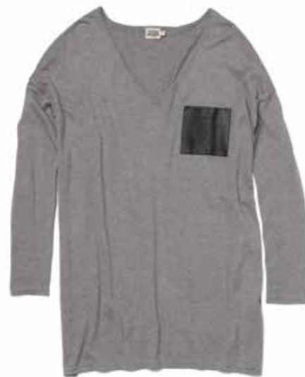
T-shirt en maille Twist & Tango