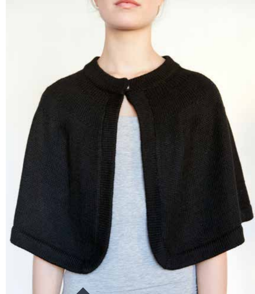
Cape en alpaga Tofelsbo

Féminines et fashion, les collections Ganni sont des incontournables au Danemark.