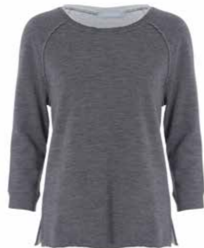
Sweat-shirt Samsøe Samsøe