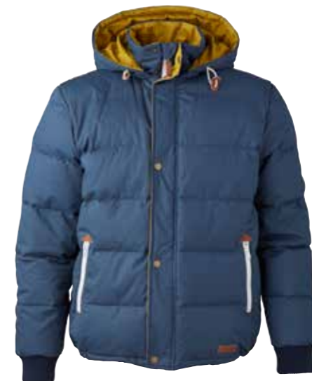
Doudoune Knowledge Cotton Apparel