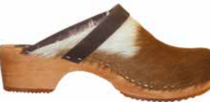
Sabots en peau de vache