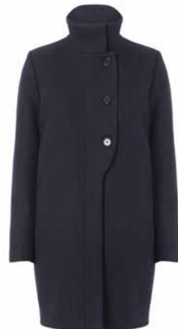
Manteau Samsøe Samsøe