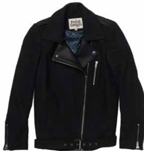
Blouson Twist & Tango