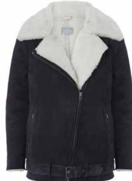
Veste fourrée Samsøe Samsøe