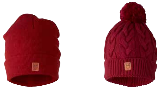
Bonnets en laine Knowledge Cotton Apparel